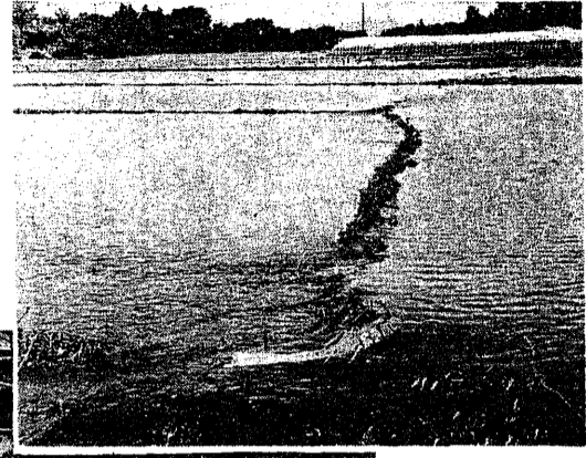
【写真右】一面水につかた耕地

昭和四十一年度一般会計補正予算案 台風四号による浸水被害への補助金、また大雨による耕地の流失、土砂の流入のための整地費の補助金、道路、橋りょうの破損箇所