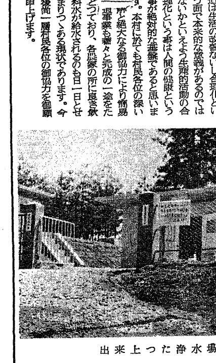
出来上った浄水場