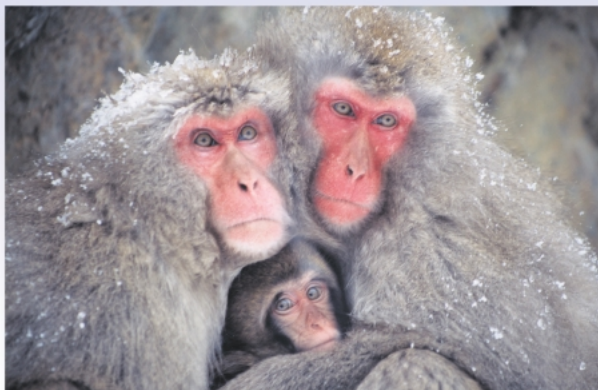
今年の干支は「申」です。