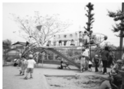
楽しい大型遊具（江南保育所）