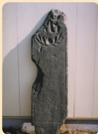
弘安銘曼茶羅板石塔婆