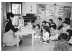
おはなしは何かな（ゆかり保育園）