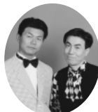
ビッグボーイズ (コント)

江南町では、第4回自主文化事業として「新春爆笑バラエティーショー」を実施いたします。新春の一時をおおいにお笑ください。多数の皆様のお越しをお待ちしています。