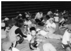
4歳・5歳児の交流「また一緒に遊ぼう」 (江南保育所・幼稚園)

入所申込書および勤務証明書の用紙は役場福祉課に用意しておりますので、受付までに書類がそろるように事前に準備してください。