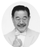
マギー司郎 (マジック)