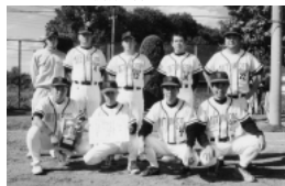
準優勝：三本ソフトクラブ