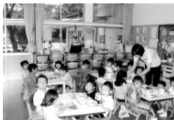
江南保育所：2歳児あひる組

入所申込書および勤務証明書の用紙は役場福祉課に用意しておりますので、受付までに書類がそろうように事前に準備してください。