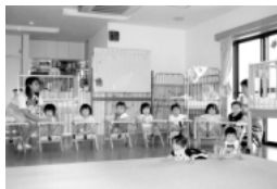
ゆかり保育園：0歳児らっこ組