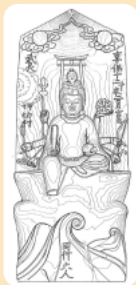
波乗弁財天 実測図