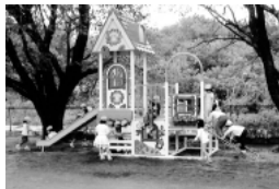
江南保育所：楽しい遊具