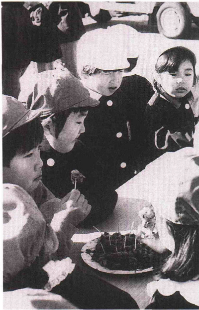
12月20日に行われた福祉もちつき

ここに募金結果をご報告して、協力いただいた地区役員さんや町民の皆さんの温かい善意に対して厚くお礼申しあ