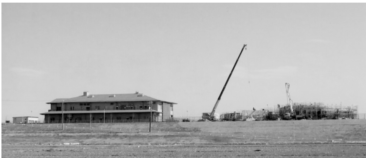
左：完成した荒川南部環境センター