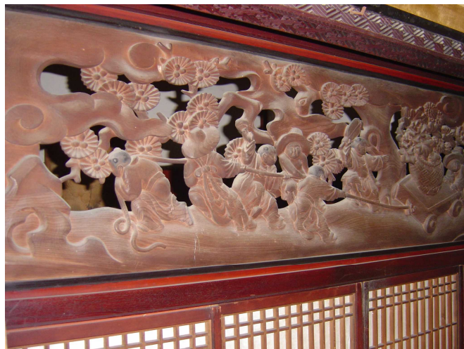
「柴田家書院」内部の彫刻